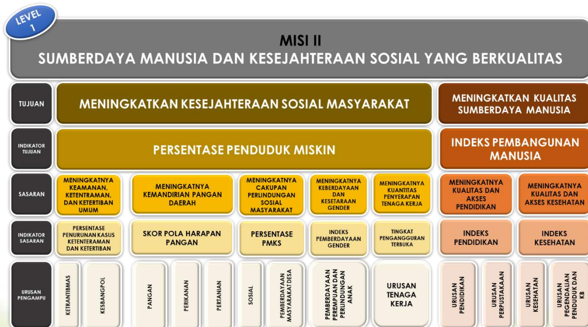
Tabel 3.2 Cascading Misi II Level 1

Dinas Sosial, Pemberdayaan Perempuan dan Perlindungan Anak melakukan supporting terhadap misi ke II. Adapun penjabaran secara matrikulasi terkait misi dan arah kebijakan kepala Daerah yang terkait pada Dinas Sosial, Pemberdayaan Perempuan dan Perlindungan Anak Kota Probolinggo adalah sebagai berikut :